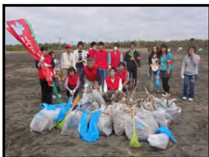
集めたゴミの前で地域の人々と記念撮影