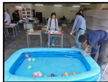
ヨーヨー釣りの準備中