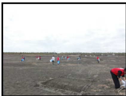
広い海岸のゴミを拾いました